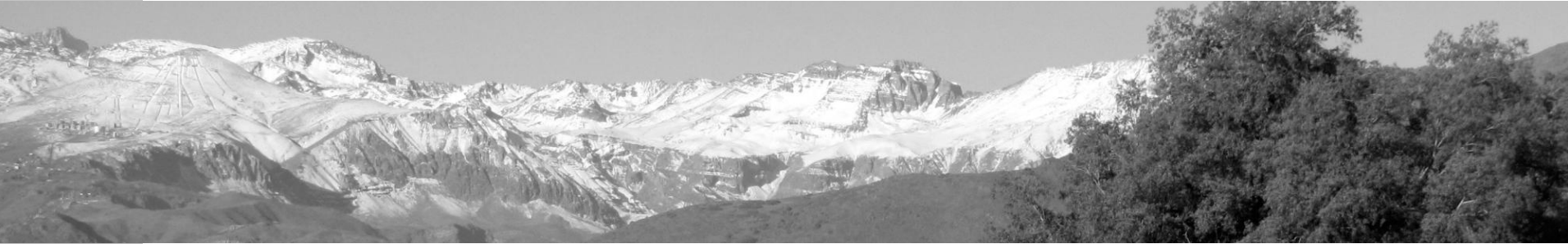
VISTA DESDE EL JARDIN CASA TIPO A