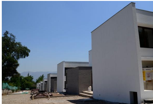
Proyecto La Fuente I (2016) 7 casas. La Fuente 1159, Las Condes.