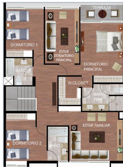
PLANTA OPCIONAL DORMITORIO 4 SEGUNDO PISO 128,97 M2