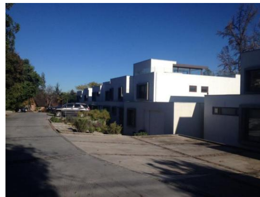
Proyecto Otoñal (2014) 6 casas. Otoñal 1033, Las Condes.