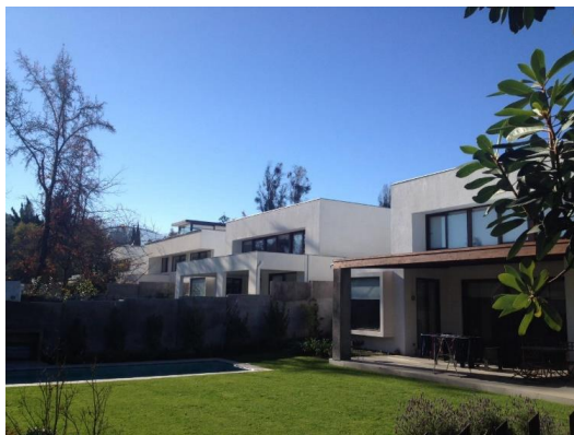
Proyecto Mirasol (2012) 4 casas. Camino Mirasol 1471, Las Condes