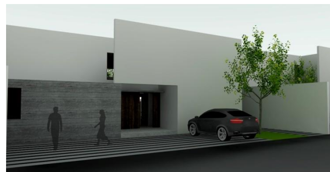
Proyecto La Fuente II (2017) 11 casas. La Fuente 1400, Las Condes.