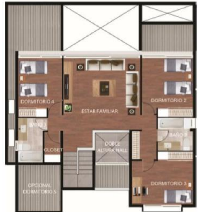
SUPERFICIE TOTAL= 250,66 M2